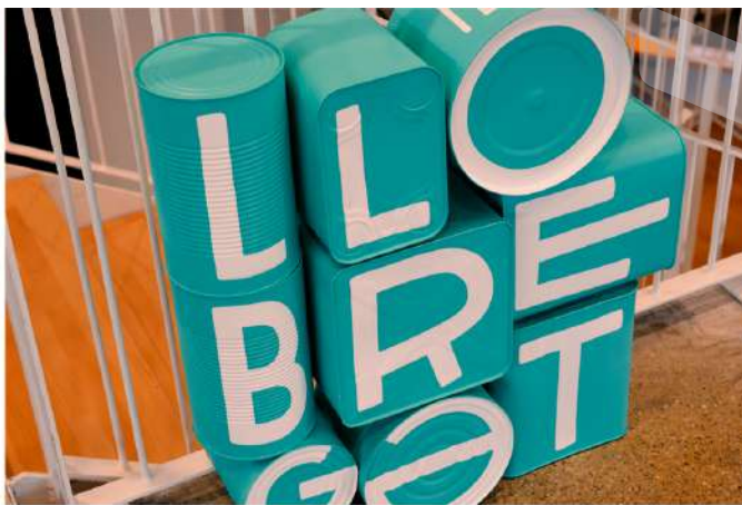
El Colectivo de arte urbano ME LATA creó 5 esculturas con el nombre de cada una de las plantas del Laboratorio.