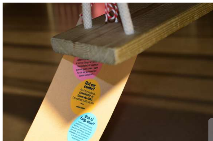
Etiquetas que cuentan el pasado, el presente y la función de los objetos que se pueden encontrar en el Laboratorio.