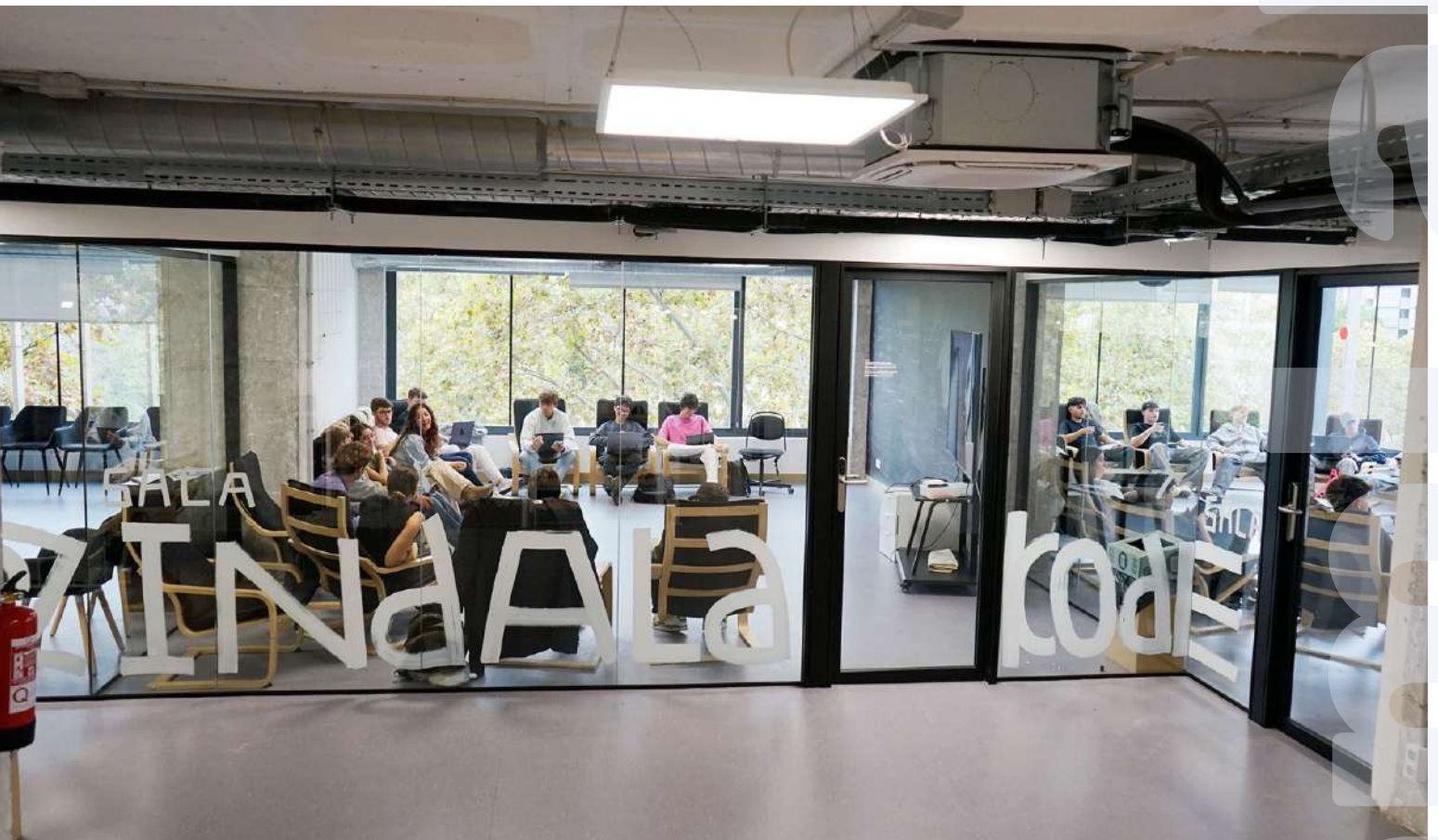
Salas de Training con los nombres de la Team Companies que han llevado la metodología de LEINN más lejos y rotuladas con la XULA BESÓS, la tipografía creada para la ocasión.